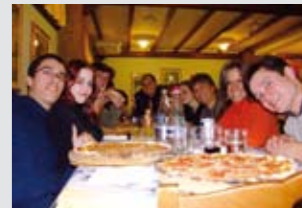
Cene e degustazioni.