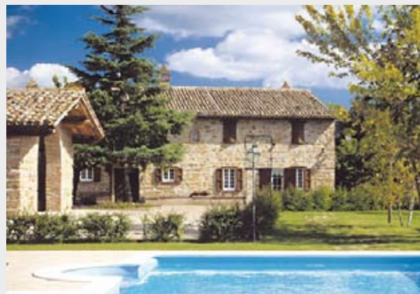
Villa Casabianca e la sua suggestiva piscina.

Chi conosce bene il nostro paese sa che non esiste una sola Italia, ma ne esistono molte. Per innumerevoli motivi storici e culturali, l'Italia si svela agli occhi dei visitatori stranieri come un complesso mosaico, fatto da infinite variazioni di colori, suoni, profumi che prendono forma nelle nostre città, famose in tutto il mondo.