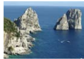
CAPRI o POMPEI