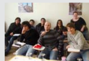
Laboratorio di gastronomia e vino.