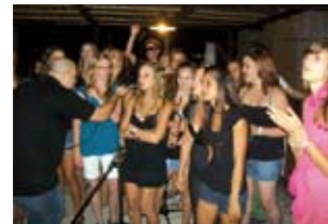
Serata di musica italiana.