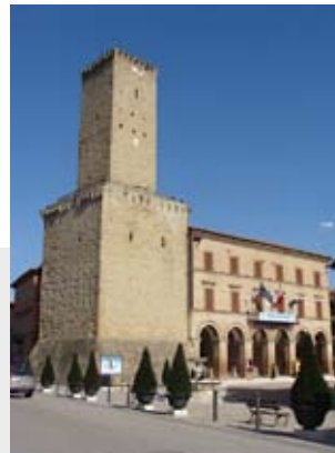
Castelraimondo, la Torre e il Palazzo comunale.