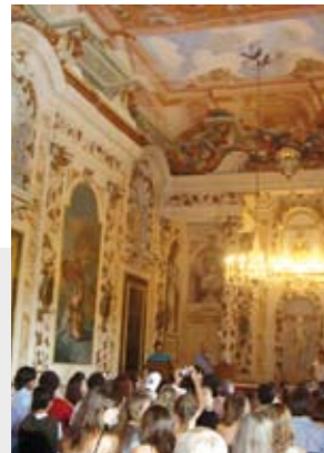
Cerimonia di consegna dei diplomi presso il Castello di Lanciano.