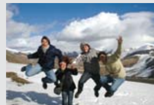
Escursioni sulla neve.