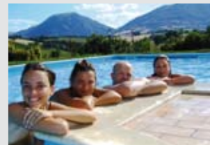
Relax in piscina.