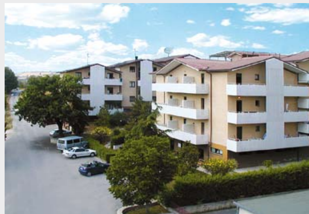
Il residence "Le Magnolie" che ospita le aule della scuola e gli alloggi degli studenti.